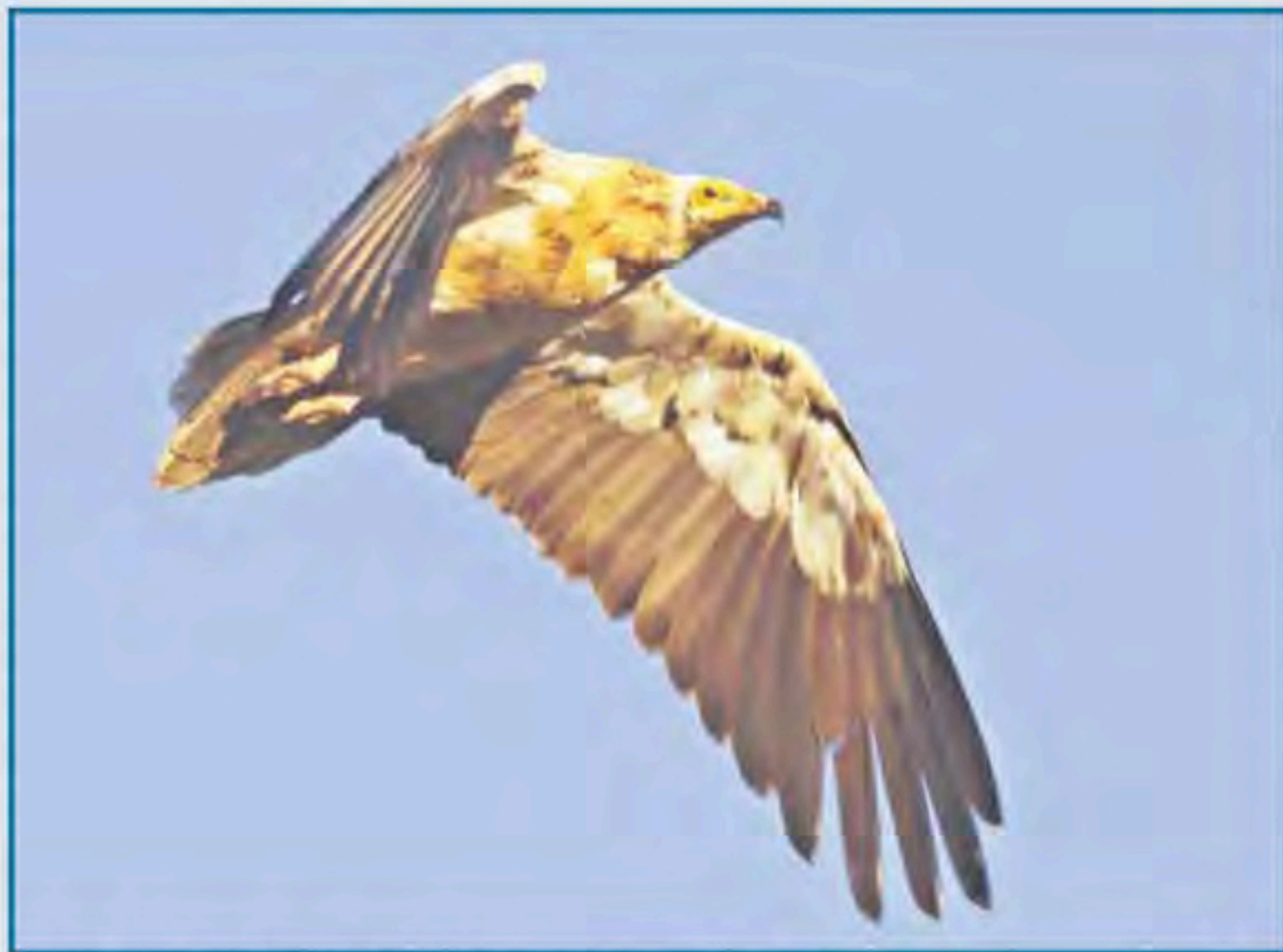
Ejemplar de alimoche adulto, una de las especies amenazadas que anida en el refugio.